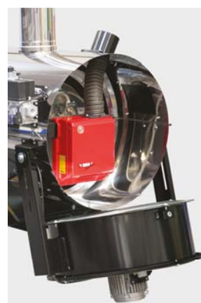
Bloc ventilateur pivotant pour accès direct