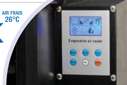
Tableau fixe et télécommande en série