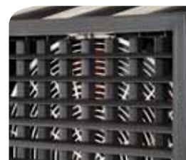
Grille avec balayage auto

Ne réclamant qu'un peu d'eau et de courant électrique, les COLD consomment jusqu'à 80% d'énergie en moins qu'une climatisation avec gaz réfrigérant. De plus leur mise en œuvre ne réclame aucune installation coûteuse. Économiques à l'achat et à l'usage, faciles à recycler, ils représentent la solution la plus économique et la plus respectueuse de l'environnement pour rafraîchir efficacement des zones pouvant atteindre plus de 200 m 2 durant la saison chaude.