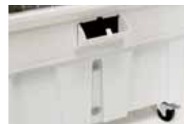
Trappe de remplissage et jauge de niveau