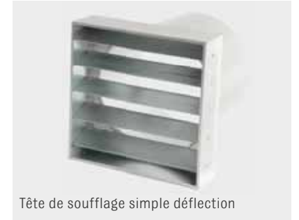
Tête de soufflage simple déflexion