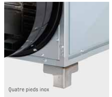
Quatre pieds inox