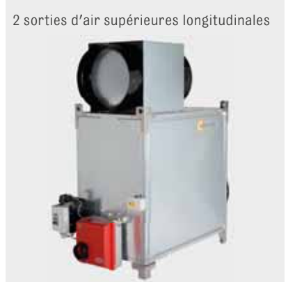
2 sorties d'air supérieures longitudinales