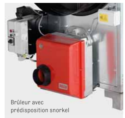
Brûleur avec prédisposition snorkel