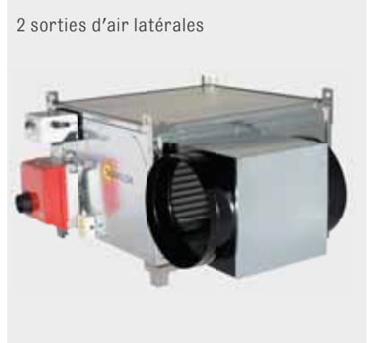
2 sorties d'air latérales