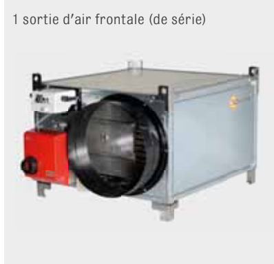
1 sortie d'air frontale (de série)