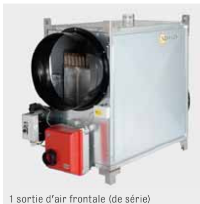
1 sortie d'air frontale (de série)