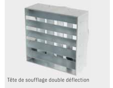
Tête de soufflage double déflexion