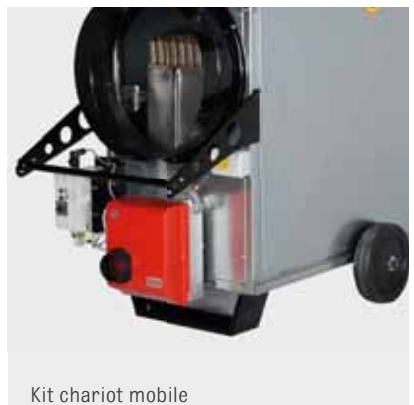
Kit chariot mobile