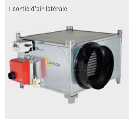
1 sortie d'air latérale