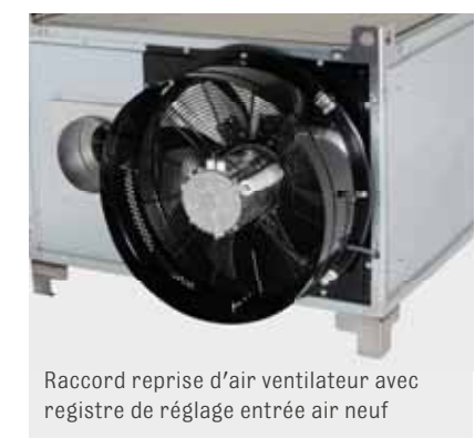
Raccord reprise d'air ventilateur avec registre de réglage entrée air neuf