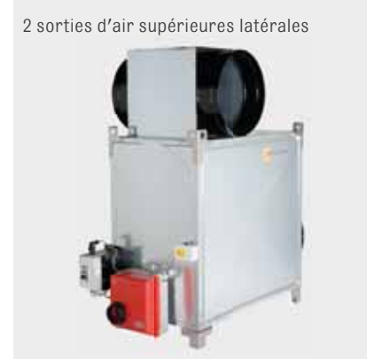
2 sorties d'air supérieures latérales