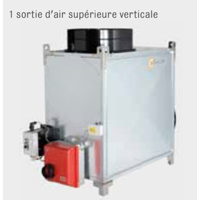
1 sortie d'air supérieure verticale