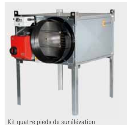
Kit quatre pieds de surélévation