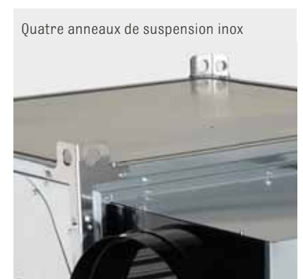
Quatre anneaux de suspension inox