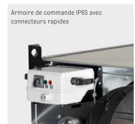
Armoire de commande IP65 avec connecteurs rapides