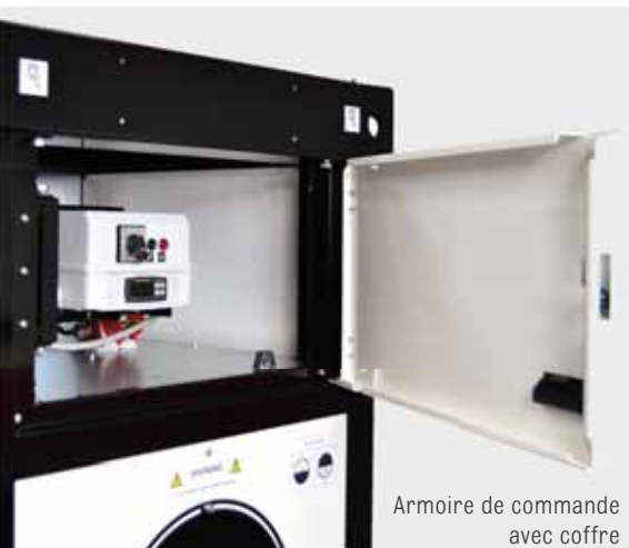
Armoire de commande avec coffre